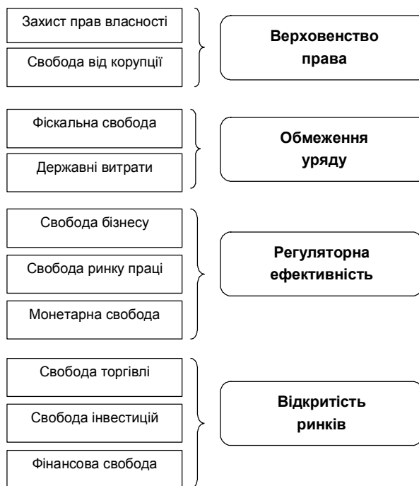
Рис. 3. Складові Індексу економічної свободи.

Отже, в основі раціональної державної політики у сфері державного регулювання трансакційними витратами лежить її інституціональне забезпечення, котре можливе при прийнятті визначених програмних заходів