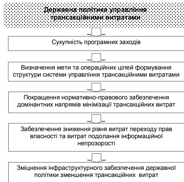
Рис. 1. Механізм управління та напрями державного регулювання трансакційних витрат (авторська розробка).

вітчизняних підприємств; втрати, що виникають внаслідок законодавчих колізій та можливості різноаспектного тлумачення одних і тих самих законодавчих актів; втрати через нерегульовані відносини власності та оренди;