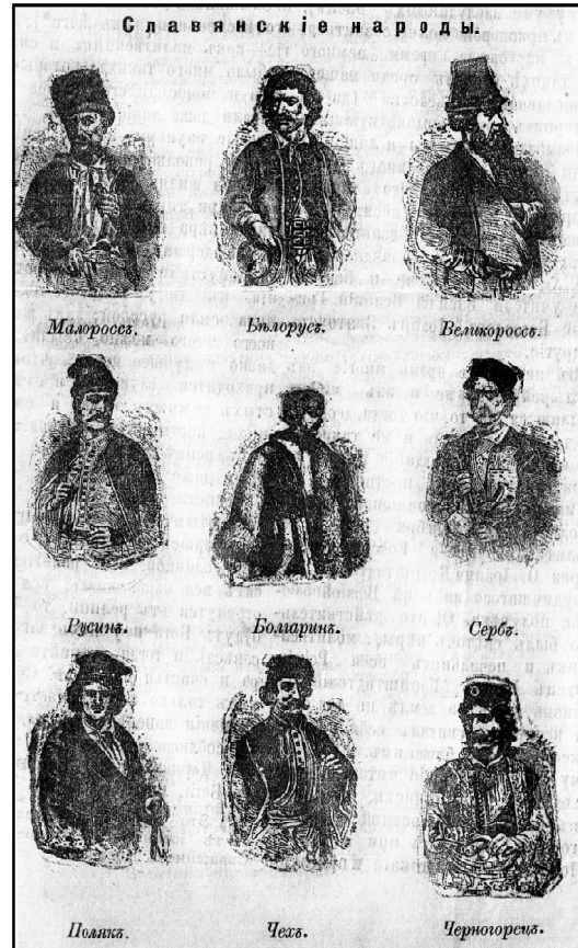
Ілюстрація до замітки "Славянские народы" (Почаевские известия, 1909, 17.03, № 714)

Показовою, на наш погляд, є звичайна ілюстрація "Славянские народы" [32] (рис. 2). На ній ми бачимо зображення представників груп слов'янських народів, але звернемо більш детальну увагу на запропонований поділ: "малороссы", "белорусы", "великороссы", "руссыны" та ін.