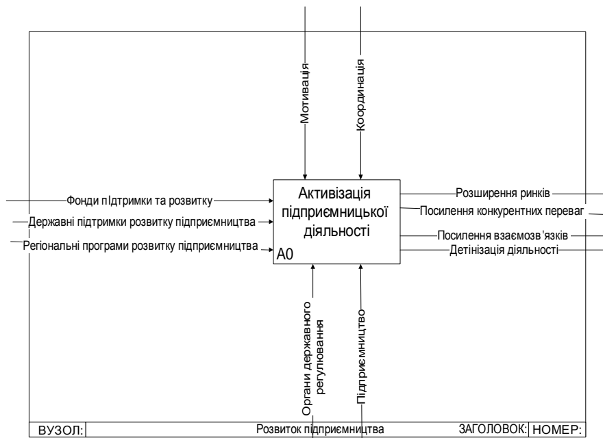
Рис. 1. Контексна діаграма процесу A0 Активізація підприємницької діяльності.