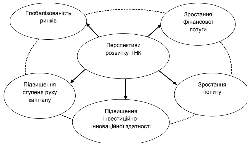
Рис. 2. Перспективи розвитку ТНК світу в умовах посткризового (глобалізаційного) зростання (власна розробка автора).

на нами "теорія розвитку та поведінки ТНК у посткризовій (глобальній економіці)". Така теорія полягає в тому, що після того, як корпорація набуває ознак ТНК і стає нею, вона повинна провадити свою діяльність, урахо-