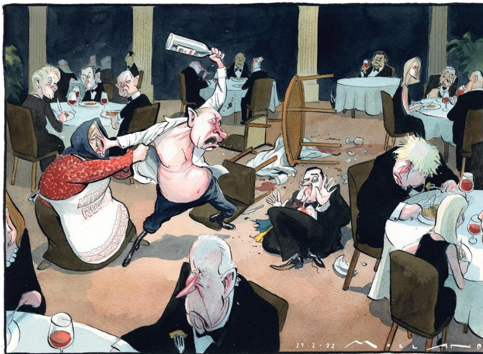
Рис. 4. Caricature №3. Morten Morland, The Sunday Times, 2022, February 27

Окремо слід наголосити на образі російського президента, якого в усіх карикатурах зображено у напівголому вигляді. Такий сюжет пов'язаний з історією 2009 р. Тоді провідні російські інформаційні агентства опублікували добірку офіційних фотографій з літнього відпочинку В. Путіна в одному із віддалених регіонів Сибіру. На більшості знімків російський прем'єр-міністр одягнений у військовий одяг та чере-