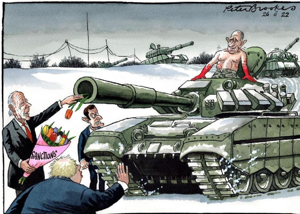
Рис. 3. Caricature №2. Peter Brookes, "Sanctions", The Times, 2022, February 26