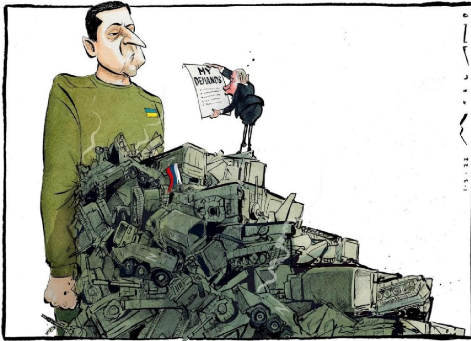
Рис. 5. Caricature №4. Morten Morland, "My demands", The Times, 2022, March 01

Реакцією на ракетні удари по українських містах й стала поява 2 березня у "The Times" чергової тематичної карикатури (рис. 6). Її створено за мотивами однойменної ілюстрації "The March of Progress" (оригінальна назва "The Road to Homo Sapiens"), виконаної