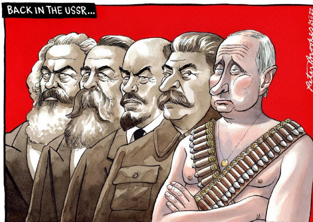
Рис. 2. Caricature №1. Peter Brookes, "Back in the USSR", The Times, 2022, February 25

ною ознакою якої було застосування сили та примусу для досягнення поставлених цілей.