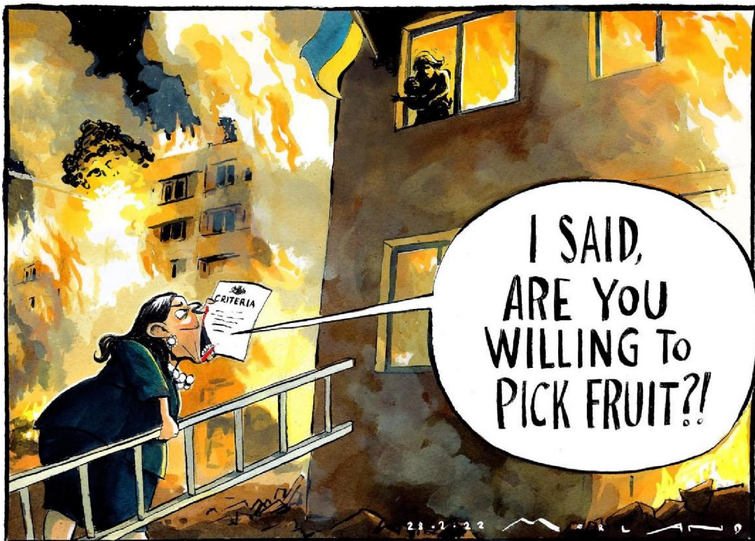
Рис. 7. Caricature №6. Morten Morland, "I said, are you willing to pick fruit?!", The Times, 2022, February 28 1

Таким чином, британські видання "The Times" і "The Sunday Times" з перших днів пильно стежили за повномасштабною війною Росії проти України. На їхніх сторінках публікувалися різноманітні матеріали, серед яких окреме місце відводилося сатиричній графіці. Остання, попри масову інформатизацію суспільства, появу нових засобів інформації, конкуренцію з боку відео та фотоматеріалів, не втратила своєї актуальності, про що свідчать багатотисячні вподобання у соціальних мережах. Аналіз змісту карикатур показав,