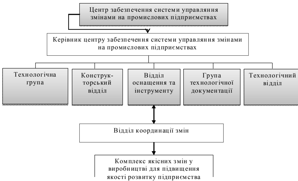
Рис. 3. Організаційна схема центру забезпечення системи управління змінами у виробництві на промислових підприємствах (розробка автора).

Таким чином, результативність впровадження проєктів розвитку на підприємствах машинобудування залежить від багатьох факторів прямого та непрямого впливу. Розробка інструментів управління забезпеченням в тому числі вимагає здійснення організаційних змін в структурі підприємств машинобудування.