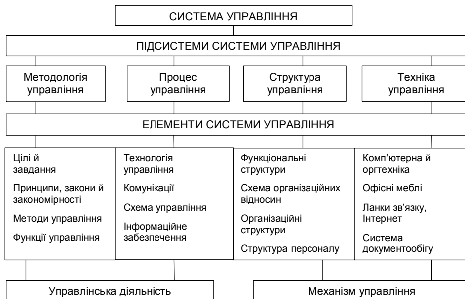
Рис. 1. Структура системи управління підприємством.

Система управління базується на таких складових: інформаційній підтримці процесів розробки й реалізації рішень; системі активізації персоналу. Оптимізація названих складових і є основним напрямком удосконалення системи управління. Ці складові дуже важливі, але фіксують деякий етап стану системи управління й відбивають лише частину сучасної системи управління, що має включати елементи розвитку, у тому числі методологічну (управлінську) підтримку при розробці й реалізації рішень (рис. 1) [3].