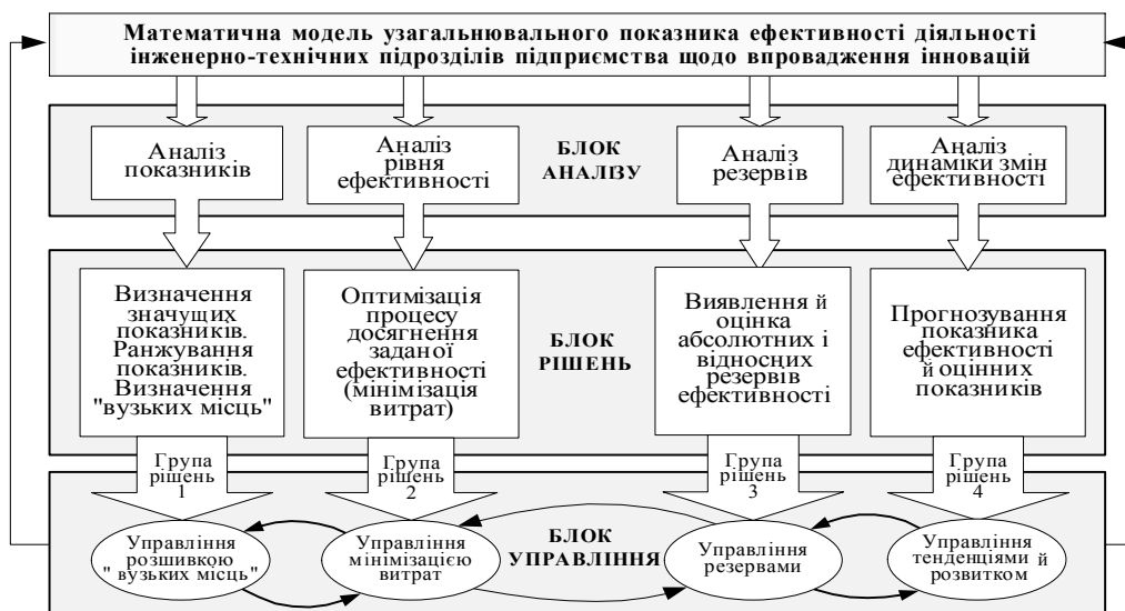
Рис. 2. Схема механізму управління ефективністю діяльності підрозділів інженерно-технічного забезпечення підприємства.

Як видно із цього рисунка, інформаційний процес реалізується в трьох блоках - аналізу, рішень й управління, у кожному з яких він розбитий на чотири групи вироблення управлінських рішень. У першій групі відбувається процес аналізу вихідних оцінних показників, визначення їхньої значущості з метою пошуку найкращих варіантів розширення "вузьких місць" у діяльності підприємств.