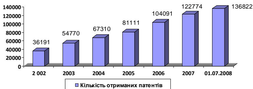
Рис. 1. Кількість отриманих патентів на гральні автомати за період 2002-2008 рр.

У результаті прийняття Закону України "Про заборону грального бізнесу в Україні" у 2009 р. було викрито 3,9 тис. фактів протиправної діяльності, серед них 1,8 тис. - надання послуг без відповідної ліцензії та 2,2 тис. - без патенту. Виявлено 13,5 тис. одиниць грального обладнання (гральні автомати та