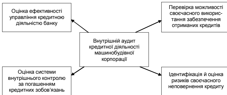
Рис. 1. Напрямки внутрішнього аудиту кредитної діяльності машинобудівної корпорації.

Внутрішній аудит кредитної діяльності корпорації може здійснюватись за напрямками, що зображені на рис. 1.