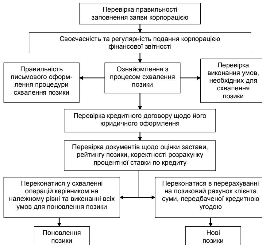
Рис. 3. Порядок перевірки кредитної документації.

Перевірка документації, що міститься в кредитній справі комерційного банку, здійснюється внутрішнім аудитором корпорації-позичальника тільки в процесі формування кредитної документації в порядку, наведеному на рис. 3.