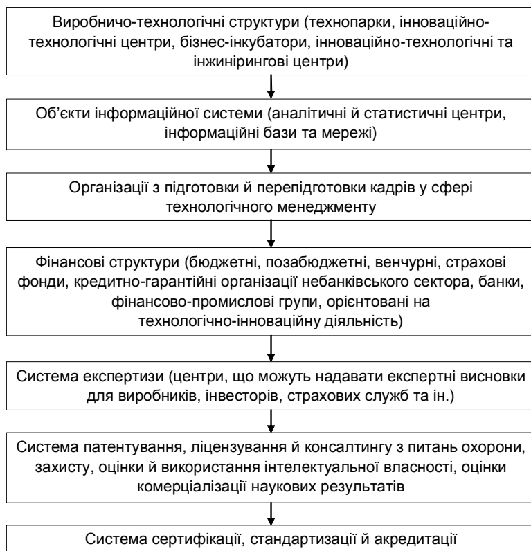
Рис. 2. Провідні структури комплексного техніко-технологічного оновлення матеріально-технічного потенціалу агросфери (адаптовано автором підхід П. Микитюка, Є. Харгадона [5, с. 186; 12, с. 15]).

начених та інших нововведень передбачений Державною цільовою програмою розвитку українського села на період до 2015 року (табл. 2). До ключових показників, які характеризують ефективність формування та відтворення матеріально-технічної бази в агросфері, належать: частка держави в придбанні технічних засобів; надання підтримки сільськогосподарським товаровиробникам для придбання сільськогосподарської техніки та облад-