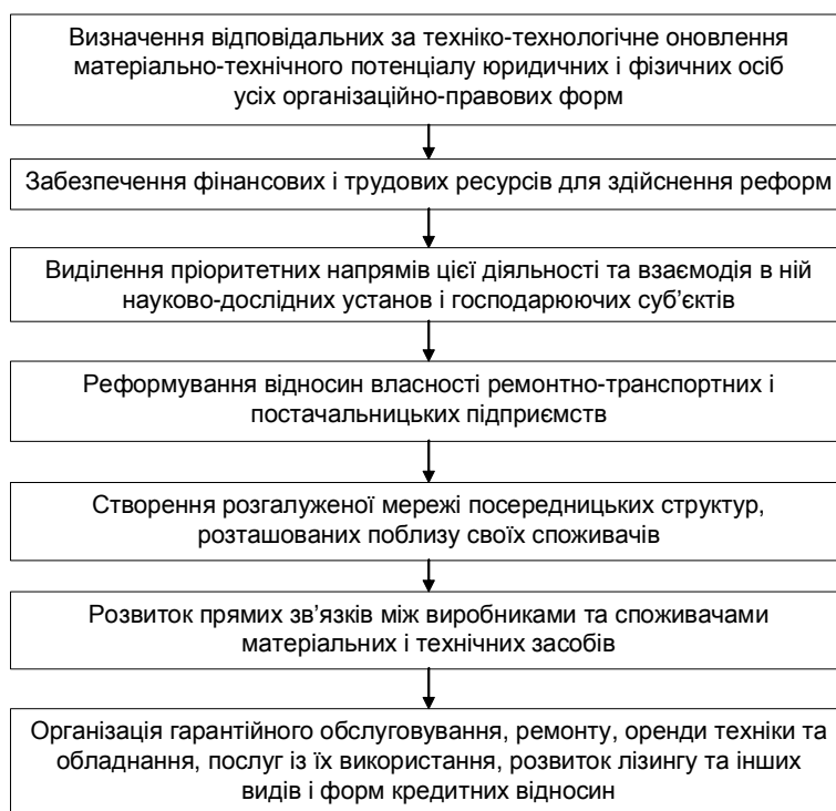
Рис. 1. Основні етапи техніко-технологічного оновлення матеріально-технічного потенціалу аграрного сектора економіки (складено автором).

Виклад основного матеріалу. У результаті аналізу нами встановлено, що існують різні підходи до трактування змісту техніко-технологічного оновлення матеріально-технічного потенціалу в аграрному секторі економіки. Вони подібні та відрізняються тільки окремими особливостями. Так, більшість науковців і практиків трактують цю категорію як комплексний процес розробки та впровадження з урахуванням впливу зовнішніх і внутрішніх чинників, нових технічних і технологічних підходів до виробництва, модернізації, переоснащення та оновлення техніки, машин, обладнання й інших складових, що забезпечують ефективну діяльність сільськогосподарських підприємств [1, с. 205; 2, с. 214; 3, с. 12; 4, с. 15]. Ураховуючи вищевказаний підхід, нами сформовані основні етапи техніко-технологічного оновлення матеріально-технічного потенціалу аграрного сектора економіки (рис. 1).