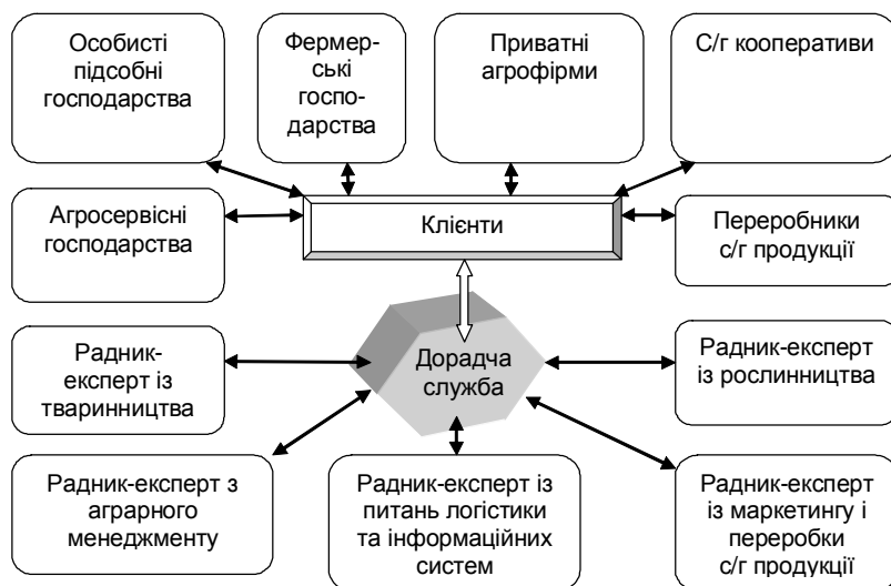
Рис. 2. Структурно-функціональна схема дорадчої служби регіону.

На нашу думку, найбільш прийнятна й економічно доцільна для всіх ланок АПК дорадча служба регіону, яка повинна мати такий структурно-функціональний зміст (рис. 2).