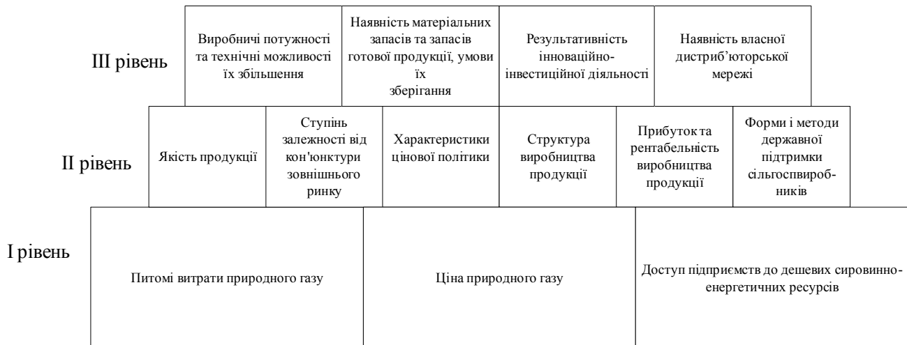
Рис. 2. Рівнева піраміда характеристик конкурентних переваг вітчизняних підприємств хімічної промисловості.