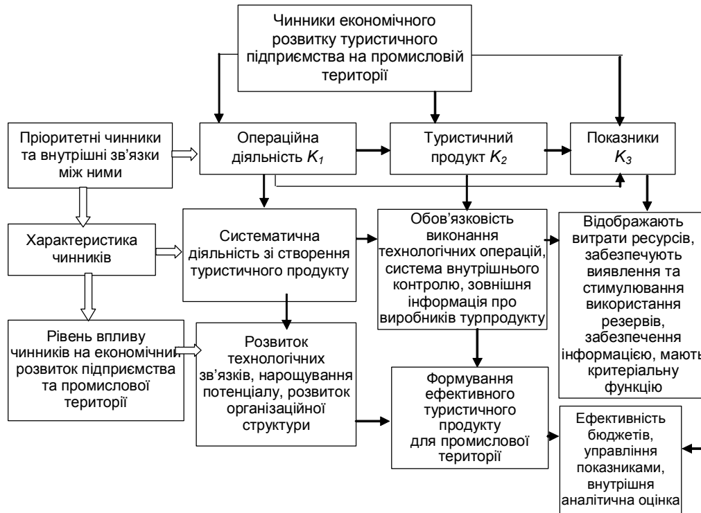
Рис. 3. Концептуальна схема вибору чинників економічного розвитку туристичного підприємства на промисловій території.

від реалізації товарів, виконаних робіт, наданих послуг.