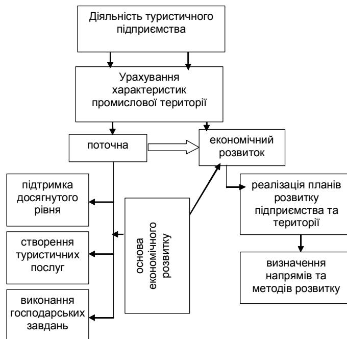
Рис. 1. Процес діяльності туристичного підприємства на промисловій території.

Для посилення сутності цієї дефініції необхідно розглянути процес діяльності туристичного підприємства з урахуванням особливостей промислової території, який може бути представлений двома частинами: частина поточної діяльності та частина розвитку (рис. 1). Перша характеризує підтримку поточної діяльності на досягнутому економічному й соціальному рівні та виробництво туристичних послуг. Господарськими завданнями на цьому етапі, аналогічно до підприємств інших галузей, є отримання прибутку, виплата заробітної плати; ефективне використання потужностей; виконання договірних зобов'язань. Друга - вирішує проблеми, пов'язані з перспективою розвитку та підвищенням конкурентоспроможності туристичного підприємства й території.