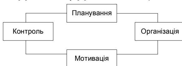
Рис. 1. Циклічний взаємозв'язок функцій менеджменту.

Кожна із чотирьох функцій менеджменту є для організації життєво важливою, але планування забезпечує основу для інших функцій і вважається головною серед них. Решта ж функцій орієнтовані на виконання оперативних, тактичних та стратегічних планів організації (рис. 1).