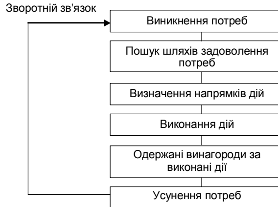
Рис. 2. Схема мотиваційного процесу.

Менеджер, перш ніж давати вказівку (завдання) підлеглому, повинен урахувати його психологічні особливості: здібності, волю, темперамент, сумісність, авторитет тощо.