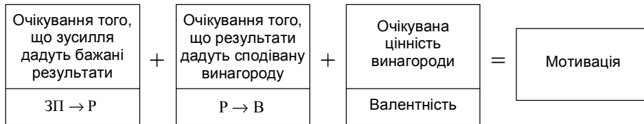
Рис. 4. Модель мотивації за Врумом.

Теорія очікувань відкриває широкі можливості для менеджерів, які прагнуть посилити мотивацію своїх підлеглих. З теорії випливає, що очікування в людей індивідуальні. Отже, їх треба вивчати не менш досконало, ніж склад потреб.