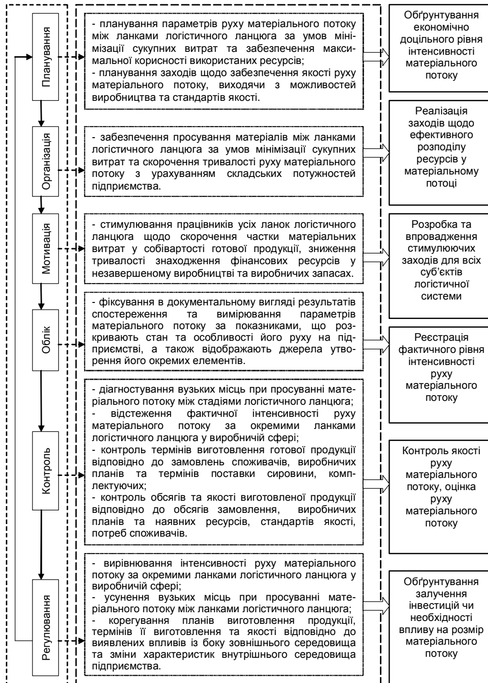
Рис. 3. Зміст функцій управління матеріальними потоками підприємства.

Конкретизацію функцій управління матеріальними потоками підприємства та управляючих дій з боку логістичної служби представлено на рис. 3.