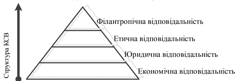
Рис. 1. Піраміда соціальної відповідальності А. Керолла.

У цьому зв'язку поширення одержав підхід А. Керолла, що запропонував погоджувати всі концепції з розвитком теорії корпоративної соціальної відповідальності [7]. За А. Кероллом, соціальна відповідальність бізнесу являє собою багаторівневу відповідальність і містить у собі економічні, юридичні, етичні, а також дискреційні очікування, які суспільство висуває організаціям у певні моменти (рис. 1). Як бачимо з рис. 1, вона носить одновекторний характер, що притаманно раннім стадіям розвитку корпоративних відносин.