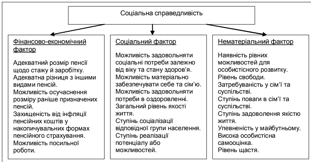
Рис. 2. Форми прояву "соціальної справедливості" через різні сфери суспільства.

пенсійного забезпечення виходить за межі формування в площині доходів та пенсійних активів, набуваючи нові форми. Характерною тенденцією розвитку категорії "соціальна справедливість" є її поширення й прояв через інші сфери суспільних відносин, що наведено на рис. 2.