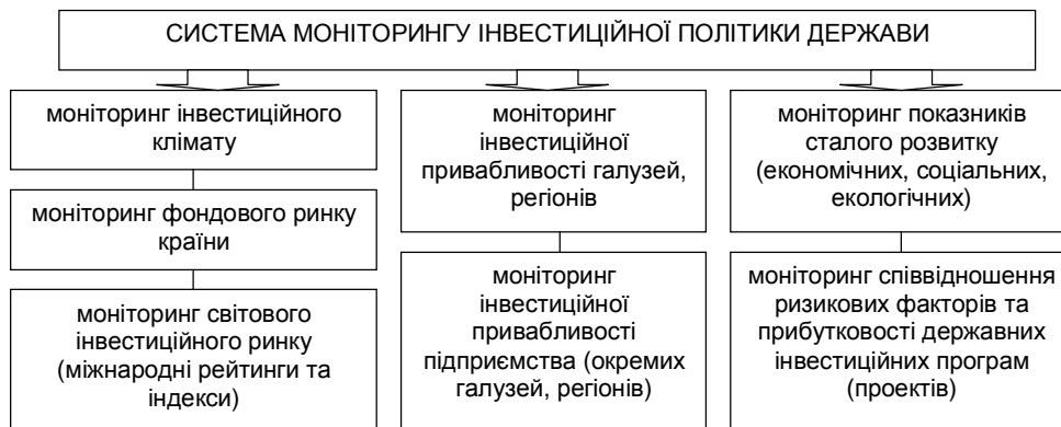
Рис. 1. Елементи системи моніторингу інвестиційної політики держави.

Інвестиційна політика повинна ґрунтуватися на комплексі чітко сформульованих цілей зі зрозумілими пріоритетами і часовими рамками для їх досягнення.