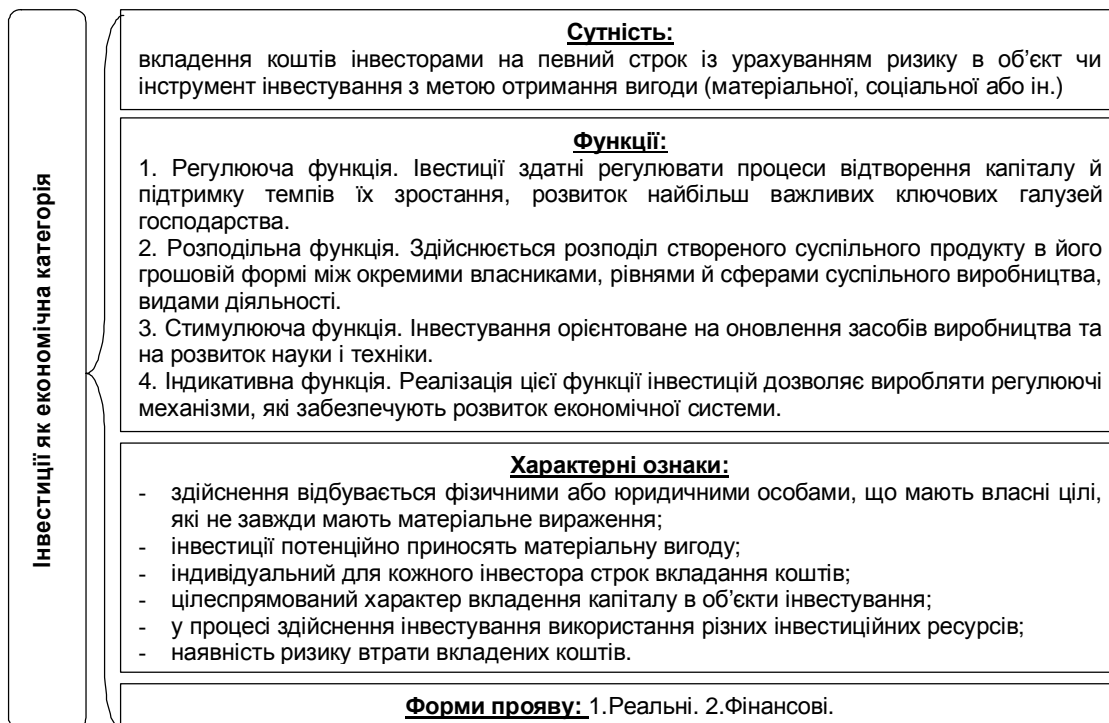
Рис. 1. Інвестиції як економічна категорія.

Інвестиції відповідають суттєвим ознакам економічної категорії, серед яких наявність сутності, специфічних ознак, що властиві тільки цій категорії, функцій та форм прояву. Тобто поняття "інвестиції" є економічною категорією, оскільки вони відбивають виробничі (економічні) відносини як свій головний предмет, мають об'єктивний характер, характеризуються сутністю, специфічними ознаками, головними функціями (регулююча, розподільна, стимулююча та індикативна) та формами прояву (реальні та фінансові) (рис. 1).