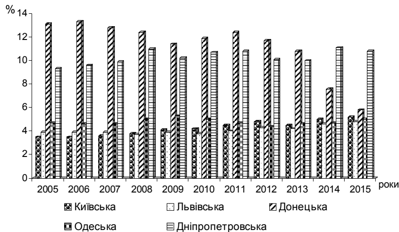
Рис. 1. Частка виробництва валового регіонального продукту в провідних областях України, %.

У Київській області 31,6 % становлять підприємства